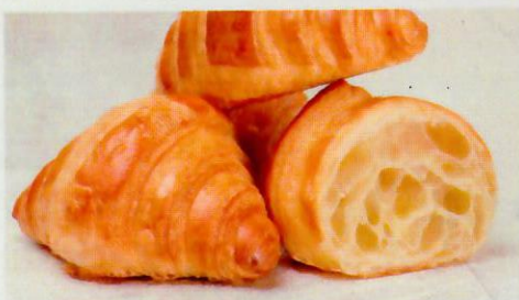
Круассан с миндальным кремом Вес 1 порции: 95 г