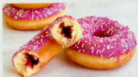
Донат с ягодной начинкой Вес 1 порции: 70 г